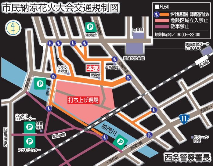
市民納涼花火大会交通規制図