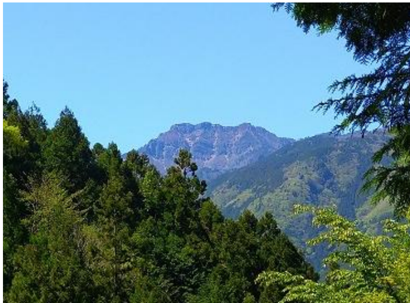
東之川集落跡から臨む石鎚