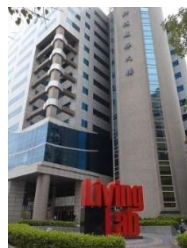
科技大樓 TJP0 にて商談