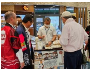
市長によるトップセールス 石鎚黒茶・海苔製品等の PR