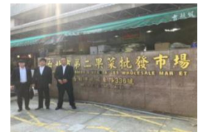
台北最大青果市場等視察