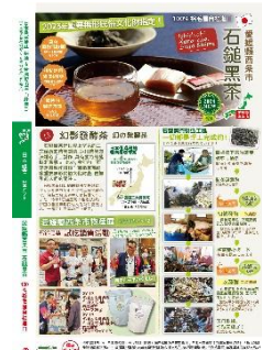
裕毛屋商品カタログ 西条市石鎚黒茶 掲載採用